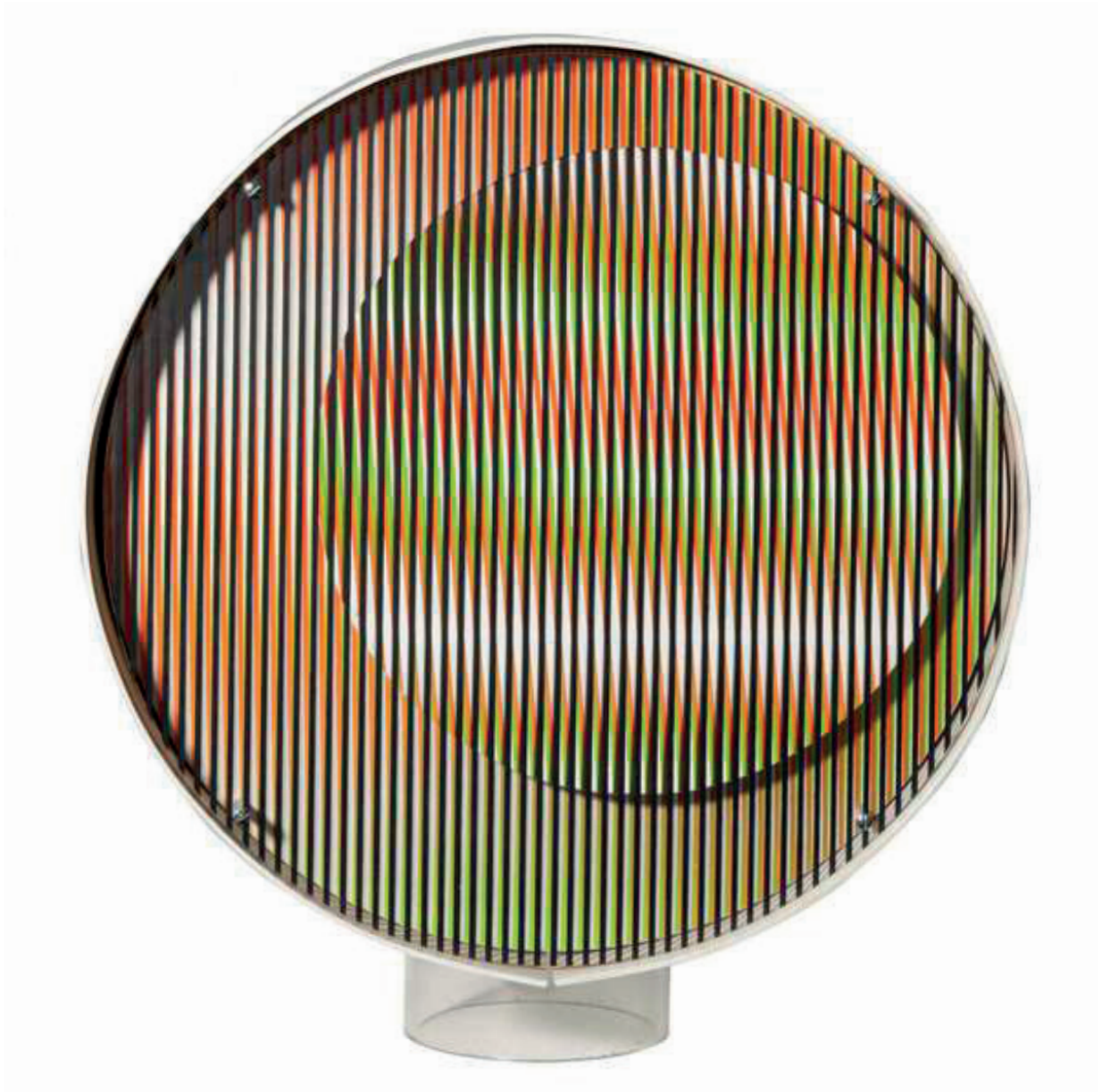
Carlos Cruz-Diez Chromointerférence, Série C , 1968, 34 x 30,2 x 19 cm (13,4 x 11,9 x 7,5 in) Acrylic, PVC, metal, painting, motor. Edition Denisé René 27/50 Courtesy Espace Meyer Zafra. © Carlos Cruz-Diez / ADAGP, Paris.