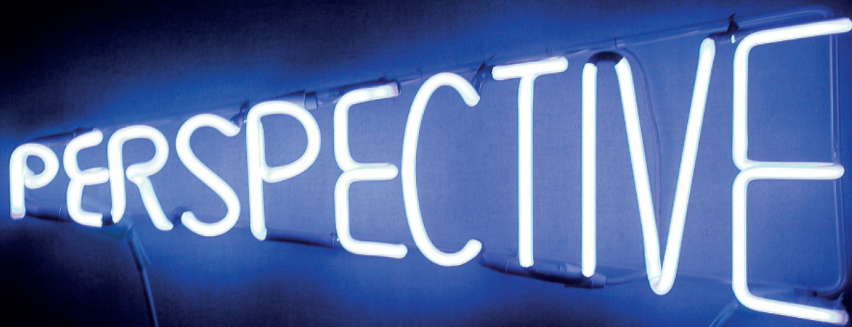
Piotr Kowalski Perspective , 1974, 20 x 55 cm (7,9 x 22 in) Neon. Edition 2/3