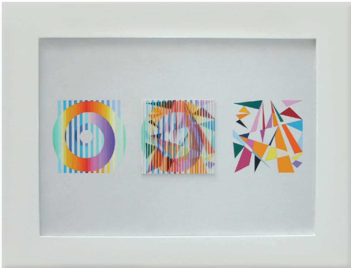
Yaacov Agam Espoir , 2003 40 x 53 cm (15,7 x 20,9 in) Oil on silk © Yaacov Agam / ADAGP, Paris.