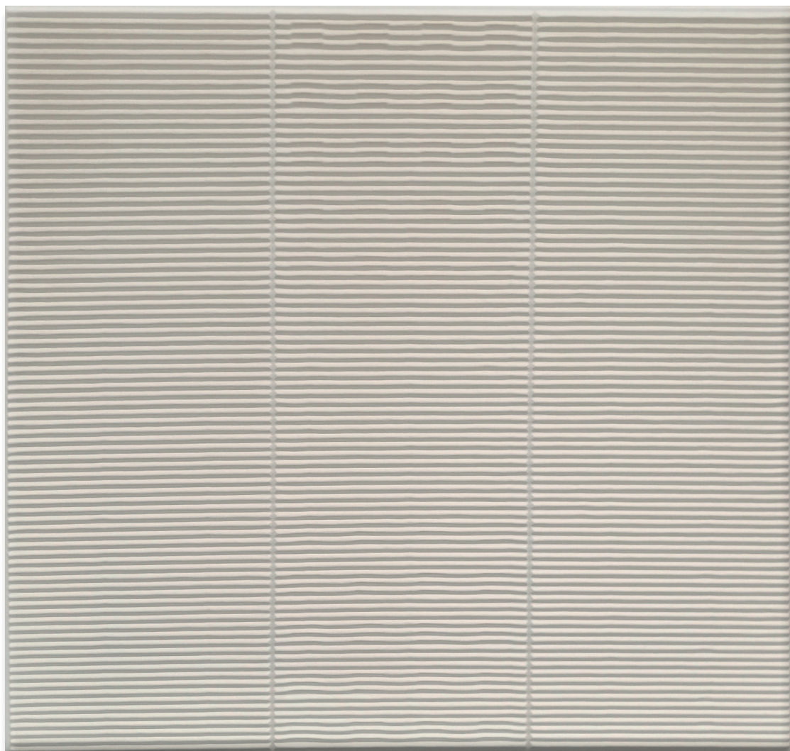
Francisco Salazar Dématisation n. 2128 , 1975, 50 x 50 cm (19,7 x 19,7 in) Wood, acrylic, corrugated cardboard