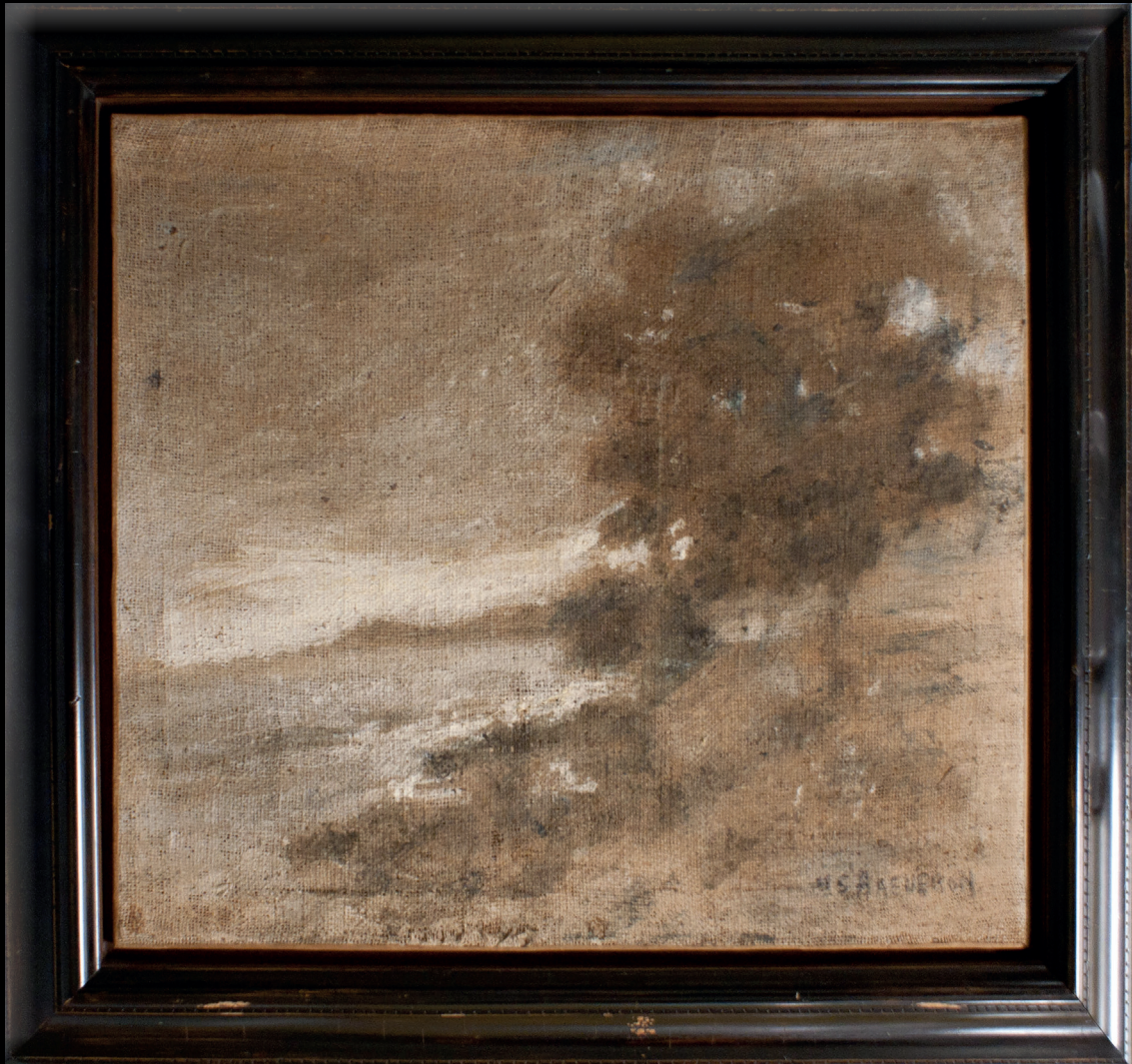
Armando Reveron El Tamarindo 1945, 74,5 x 74,5 cm (29,3 x 25,4 in) Tempera on burlap

Exhibited Caracas, Museo de Bellas Artes, Exposición retrospectiva de Armando Reveron, July 1955, no. 156, p.28