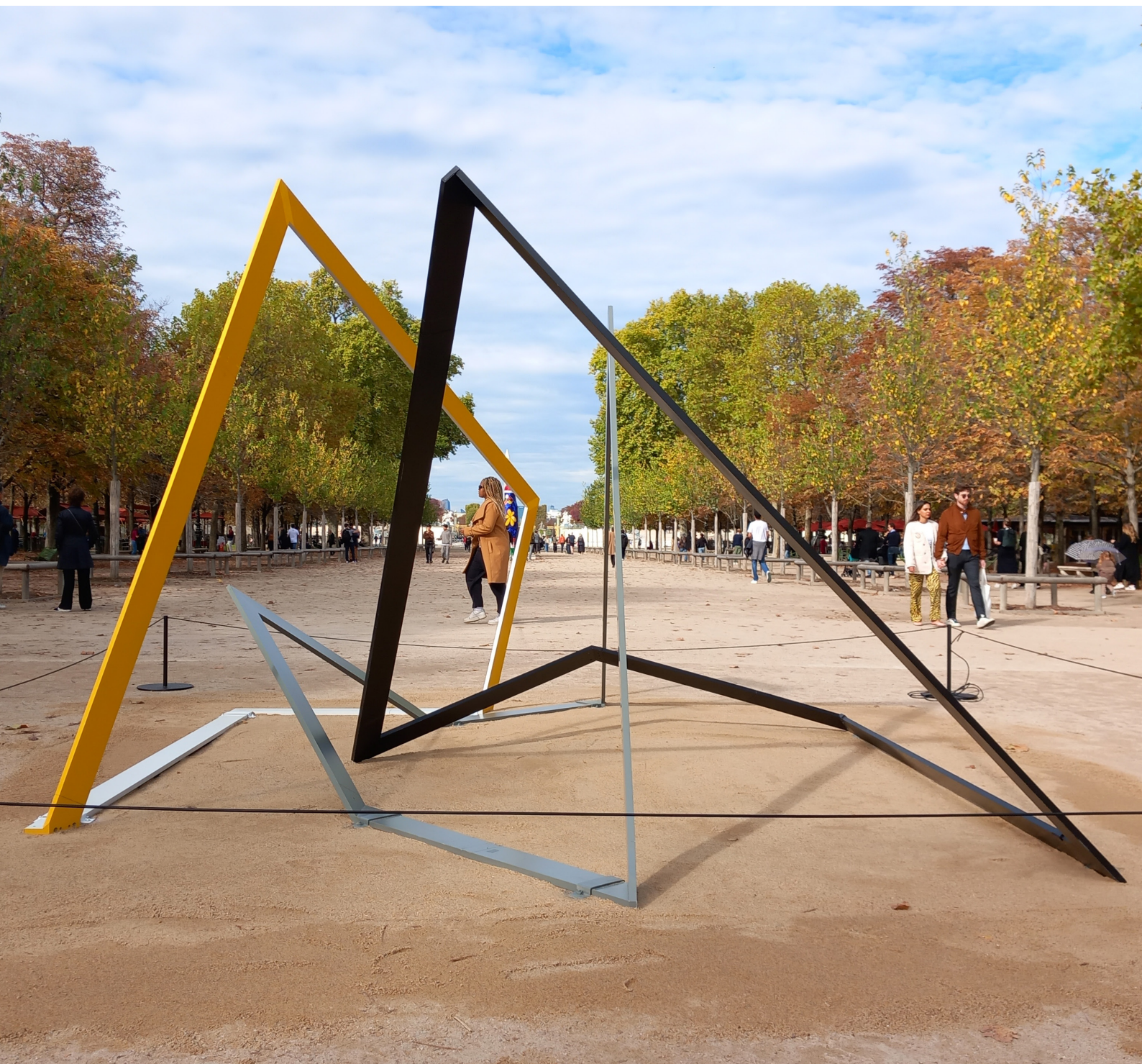
Grazia Varisco Gnom-one, two, three, 1984, 300 x 450 x 450 cm (118,1 x 177,2 x 177,2 in) Aluminium, iron, varnish

Exhibited Paris + Art Basel, Jardin des Tuileries, Paris, France, October 2022