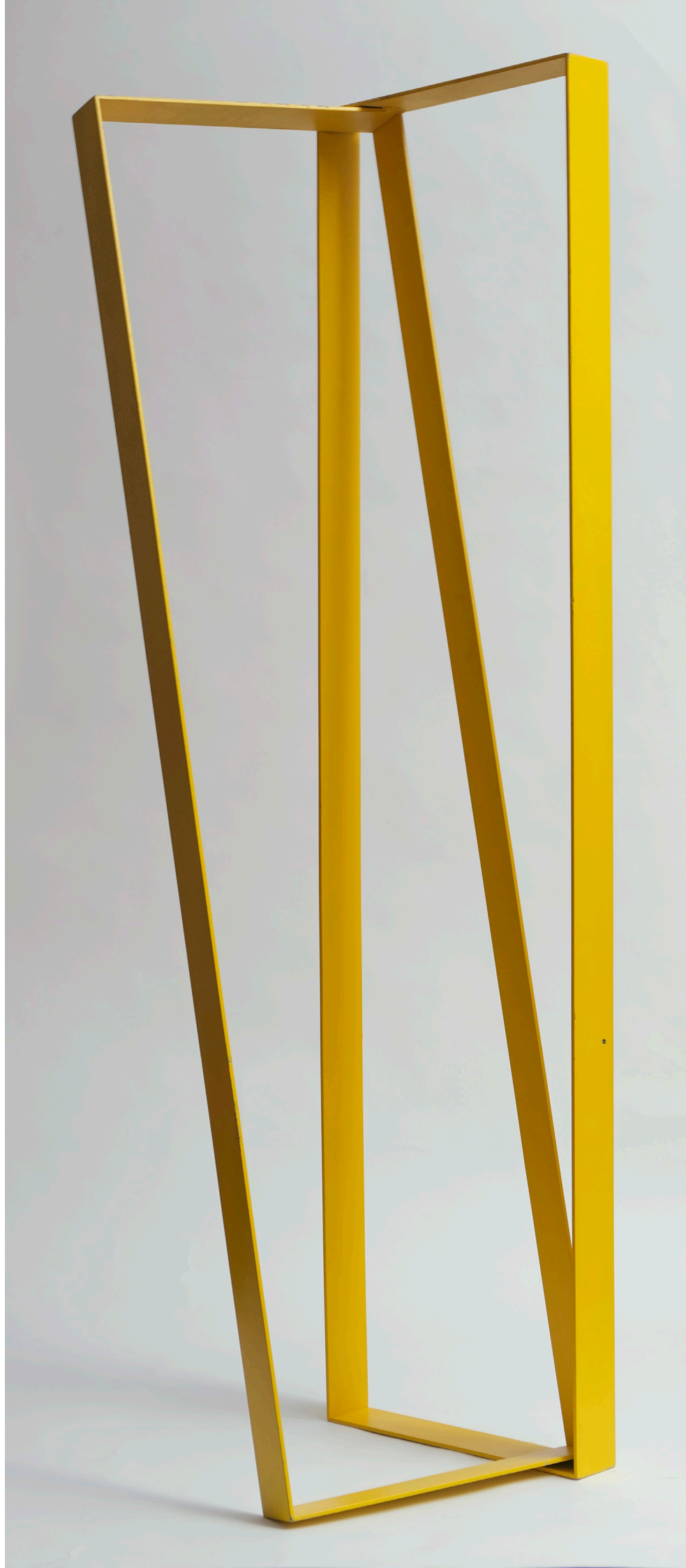
Grazia Varisco Incastro giallo , 1987 160 x 65 x 50 cm (63 x 25,6 x 19,7 in) Two frames in painted iron